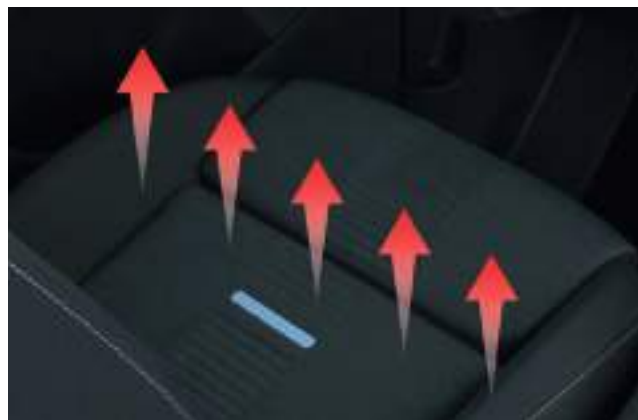
Podgrzewanie foteli przednich - zestaw do dwóch foteli UWAGA: montaż musi zostać przeprowadzony wyłącznie przez Autoryzowany Serwis. 1 170 zł