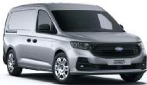
STARDUST SILVER - LAKIER METALIZOWANY 2 000 zł