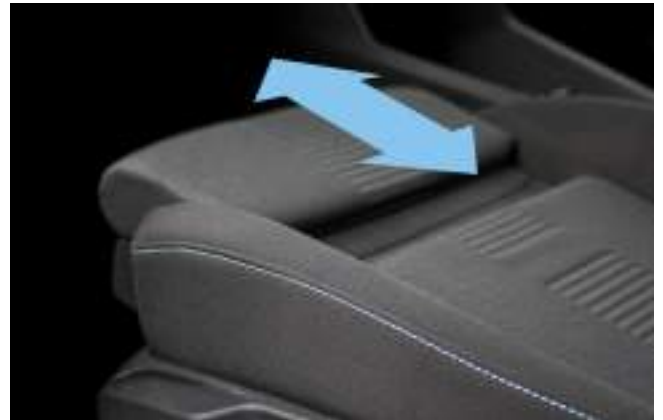
Fotel kierowcy AGR Opcja dla wersji Limited i Active dostępna tylko w pakietach foteli (str. 15)