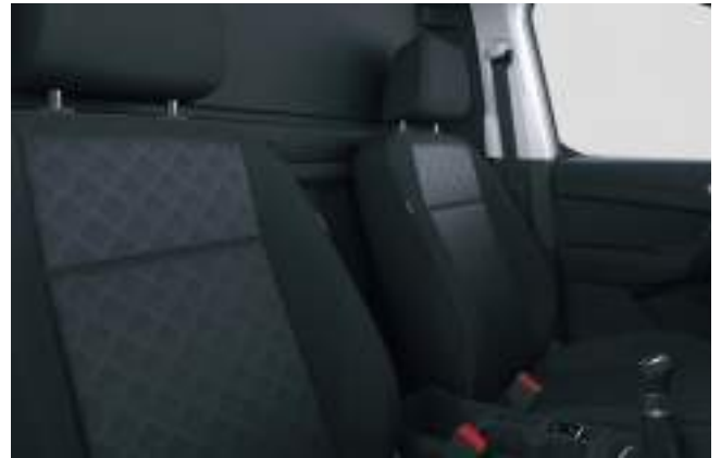
Tapicerka skórzana (skóra ekologiczna Sensico) Opcja dla wersji Limited