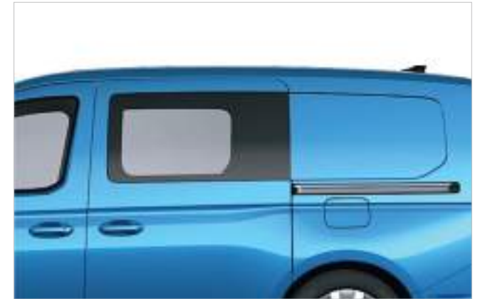
Drzwi boczne z oknem - odsuwane po obu stronach Opcja dla wersji VAN. Standard dla wersji FlexCab