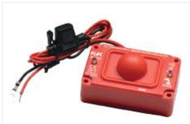
Odstraszacz Kun M2700, z ochroną ultradźwiękami 400 zł