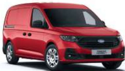
LAVA RED - LAKIER ZWYKŁY bez dopłaty