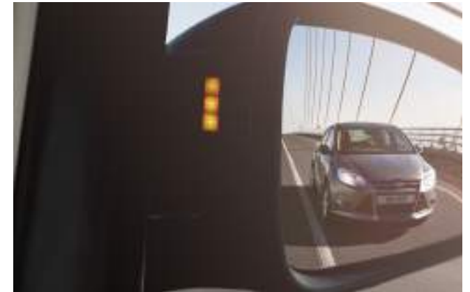
Blind Spot Information (BLIS) z CTA i EW Standard dla wersji Limited i Active