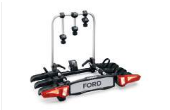
Uchwyt do przewozu rowerów - ocowany na haku holowniczym Dostępny w wersji na 3 rowery 2 130 zł