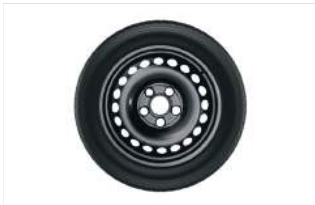
Komplet kół zimowych, felgi stalowe 16" Z czujnikami ciśnienia, opony Dunlop WINTER SPORT 5, 205/60 R16 96H XL 3 408 zł