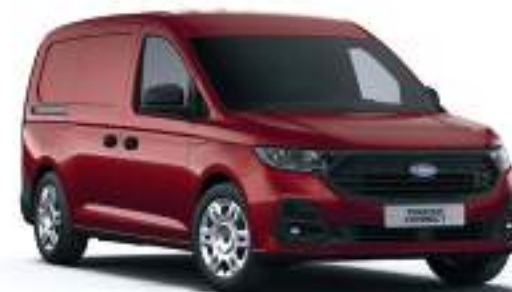
MAPLE RED - LAKIER SPECJALNY 2 000 zł