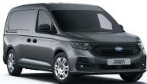
GRAPHITE GREY - LAKIER METALIZOWANY 2 000 zł