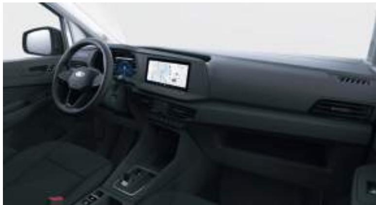
Nowy Ford Transit Connect ze skrzynią automatyczną i tapicerką materiałową (standard)