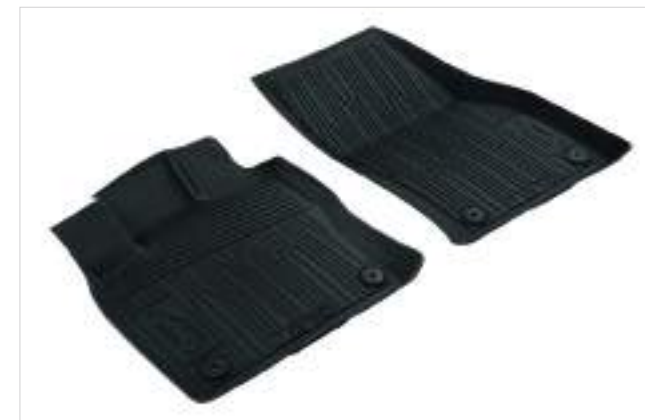
Dywaniki podłogowe, gumowe na przód, czarne 356 zł