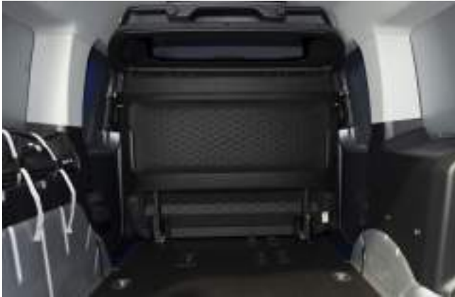
Przegroda pełna bez okna Stanard tylko dla wersji VAN