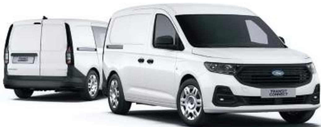
Nowy Ford Transit Connect VAN i FlexCab (po lewej stronie) w wersji L2 z lakierem zwykłym Frozen White (opcja)