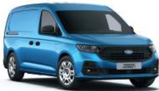
BOUNDLESS BLUE - LAKIER METALIZOWANY 2 000 zł