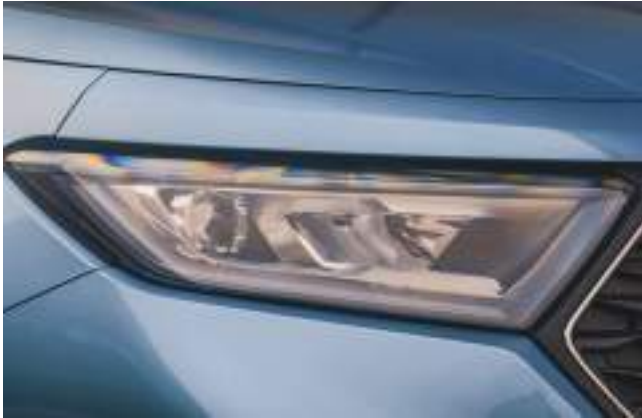
Reflektory w technologii Full LED Standard dla wersji Active. Opcja dla wersji Limited.