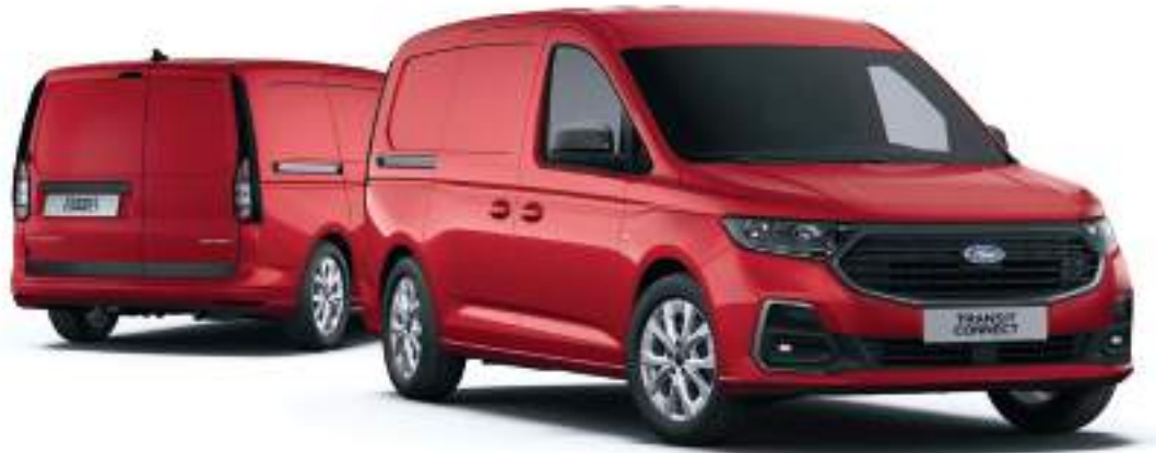
Nowy Ford Transit Connect VAN w wersji L2 z lakierem zwykłym Lava Red (bez dopłaty)