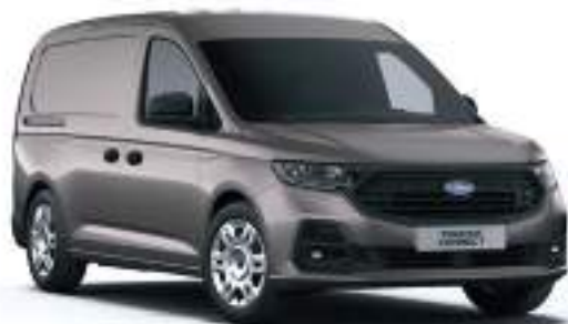
DUSKY SILVER - LAKIER METALIZOWANY 2 000 zł