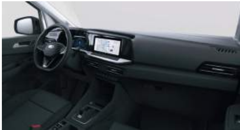
Nowy Ford Transit Connect ze skrzynią automatyczną i tapicerką materiałową (standard)