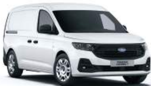
FROZEN WHITE - LAKIER ZWYKŁY bez dopłaty