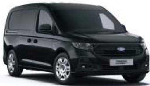
INK BLACK - LAKIER METALIZOWANY 2 000 zł