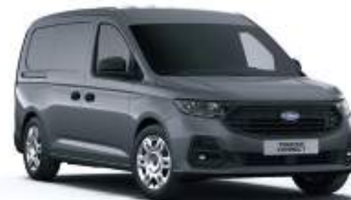
COMET GREY - LAKIER ZWYKŁY bez dopłaty