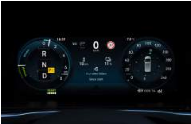
10,25" cyfrowy, konfigurowalny zestaw wskaźników Premium Standard dla wersji Trend z napędem hybrydowym PLUG-IN Hybrid Standard dla wersji Limited i Active