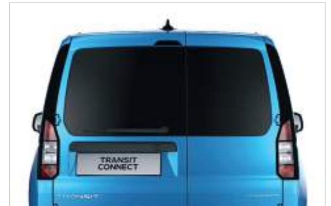
Szyby w drzwiach tylnych z wycieraczką i spryskiwaczem Opcja tylko dla wersji FlexCab