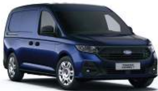
MIDNIGHT BLUE - LAKIER METALIZOWANY 2 000 zł