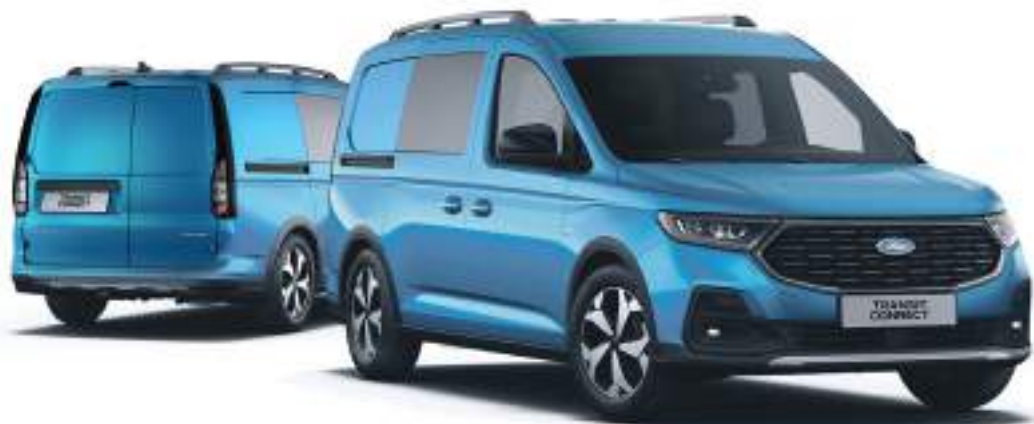
Nowy Ford Transit Connect Active FlexCab w wersji L2 z lakierem metalizowanym Boundless Blue (opcja)