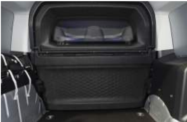
Przegroda pełna z oknem Opcja tylko dla wersji VAN